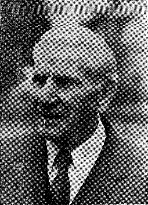
Isidoro Fagoaga Beratar gizon ospetsua. (Aida argazkia).

Isidoro Fagoaga, beratar gizon ospetsua ta bere liburutegia