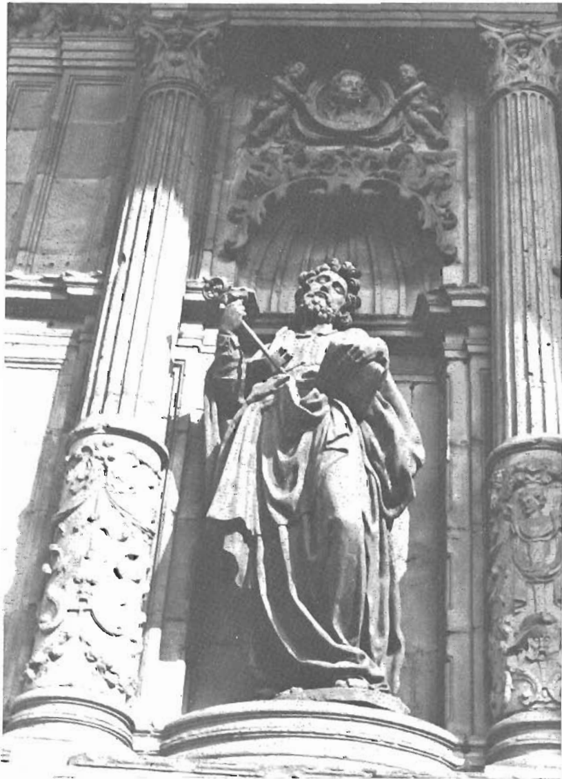
EUSKALDUNEN IRUDIGINTZA BARROKO-TANKERAZ ANTXIETA'K (Kepa D. a , Bilbo'ko San Anton'en)