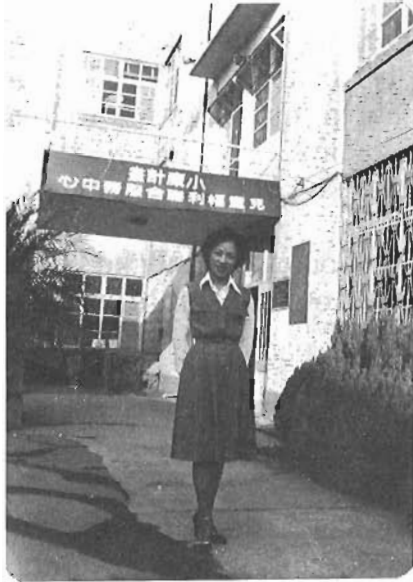
ARTU eizu BETA

Ziur beta zerbait egiteko aldi edo une dogu. Utzi leikena eta bere garaian artun geinkena. Eta: