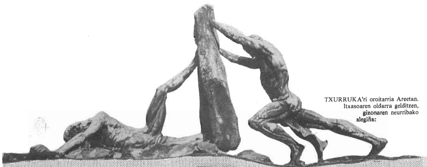
TXURRUKA'ri oroitarria Areetan. Itxasoaren oldarra gelditzen, gizonaren neurribako alegiña: