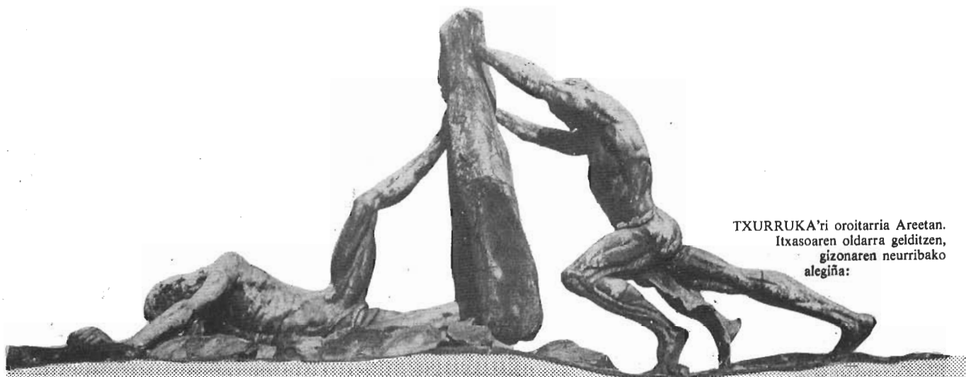
TXURRUKA'ri oroitarria Areetan. Itxasoaren oldarra gelditzen, gizonaren neurribako alegiña: