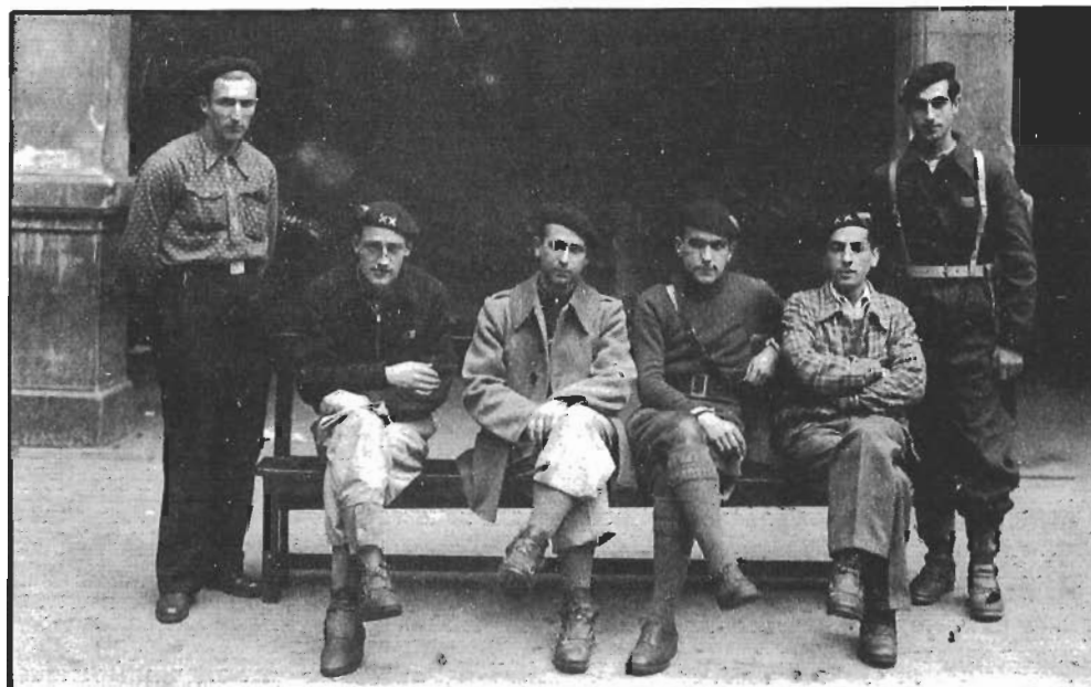
GUDAKO ZEREGINETAN (EZKERRETIK IRUGARRENA LAUAXETA)