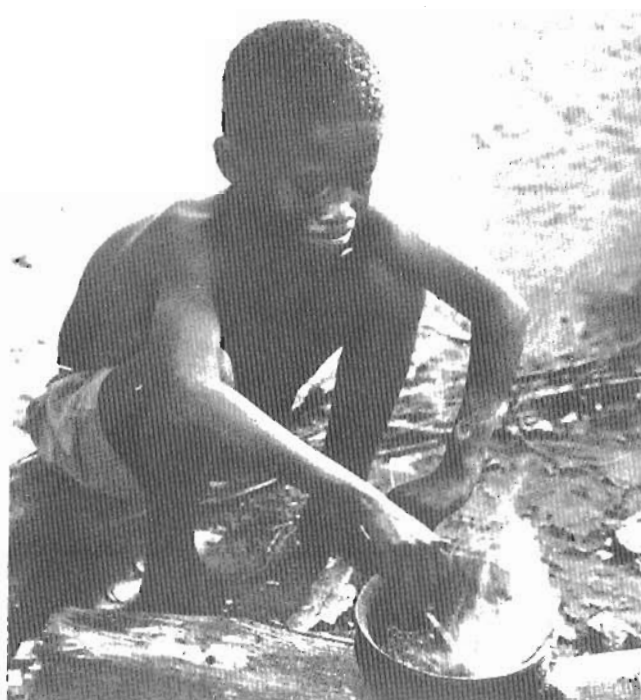
Zure laguntza eldu egiten da eta zuk ori ziur jakin zeinke.

Il onetan, zezeillean, egiten da diru-batzerik eza-gunena, gosearen eguna ospatuz, baiña edonoz emon leike laguntza.