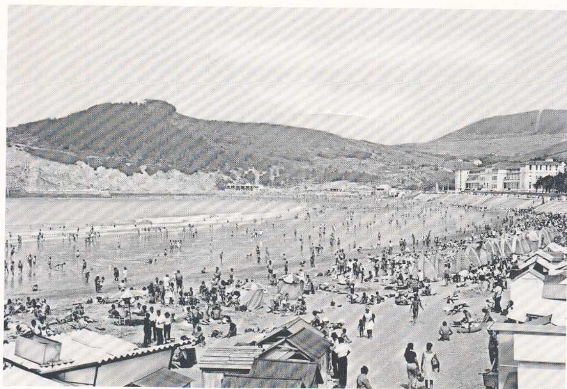
GORLIZ'KO ONDARTZA EDERRA BIZKAI'KO TXOKO ZORAGARRIA