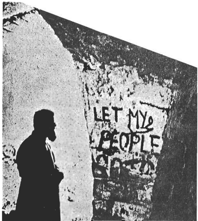
ALKAR - IZKETAN