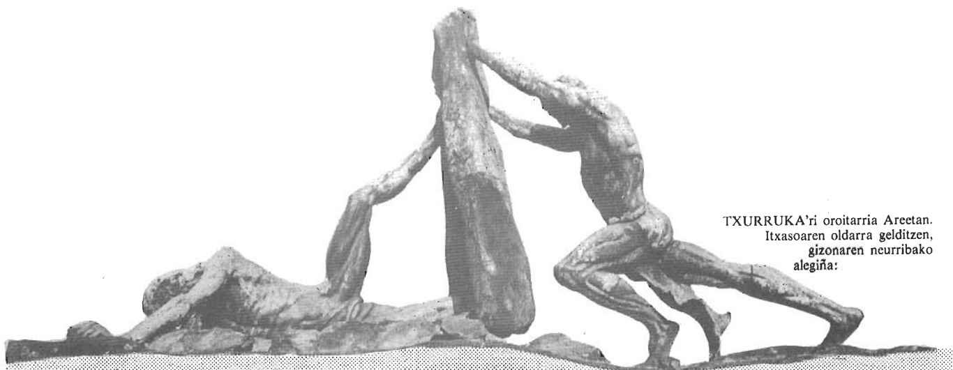
TXURRUKA'ri oroitarria Areetan. Itxasoaren oldarra gelditzen, gizonaren neurribako alegiña: