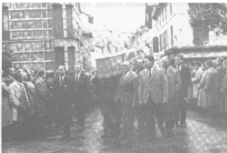
Paris'ko Passy auzoan illa 1960'garren Martxoa 22.