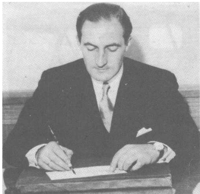
Jose Antonio Aguirre Euzkadiko Lenengo Lendakaria.

Estella'ko Estatutoaren billa gebiltzala, Iruñan Mola militarra jeiki zan Errepublikaren aurka, 20.000 napar karlista berekin zituela, Uztailaren emeretzian, 1936'garren urtean. Egun artan zan Beasain'go Batzokiaren asiera