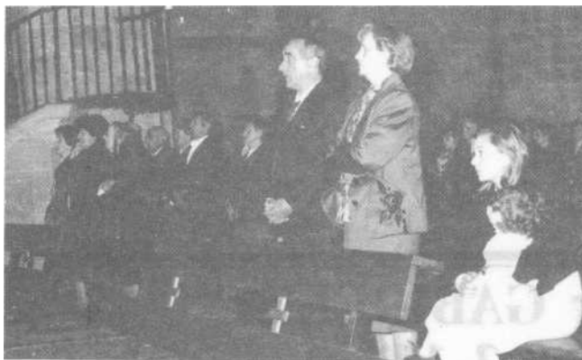
Zeanuri'ko eleizan senideak eta erritarrak.

garaia zan. Gasteiz'en bertan soldaduska egiten egoala gaixotu ta Militar gaixotegian il zan 1936'an.