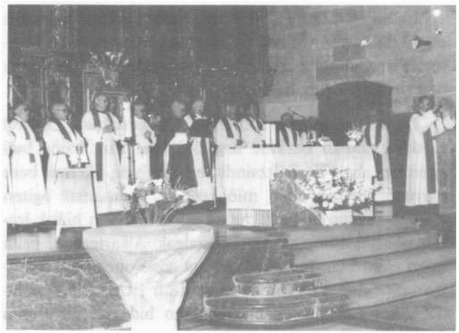
Omenaldiko mezea: Aurreko bateo-arri orrelan izan zan bateatua, orain 100 urte D. Gabirel.

Eleiz-barruko giroan fededunai begiratzea eta