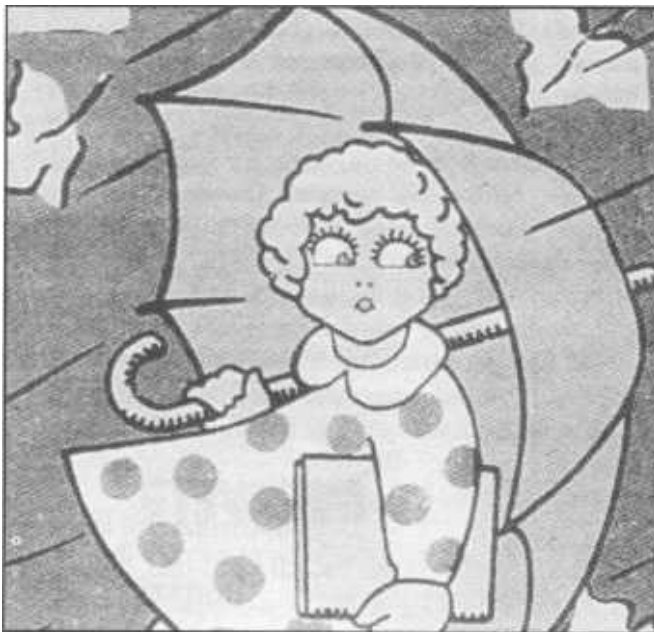
1931 -11. iku.rtuluko esku-liburu baten tiza/a, Gero gerokoak'

Eta beste au be gogoratu bear dogu: Jaiotzen zerrenda ekarren liburuetan, nik Bilbao'koetan ori ikusi egin dot, euskeraz idatzita egozan izenak Franco'ren aginduz kendu egin zirala eta orde z egokiezan erderazkoak ipiñi zirala. Franco'tarrak euskereari eutsoen gorrotoa eta ezarten eutsoen zapalkuntza oso nabarmena zan.