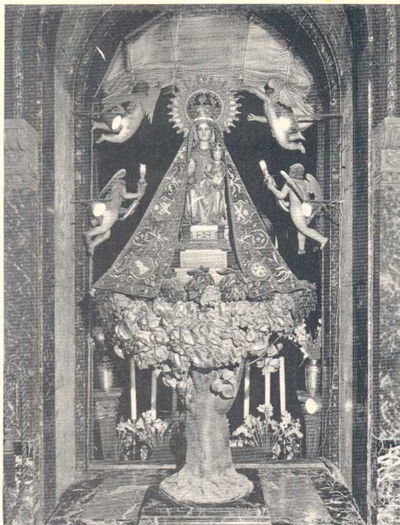
ANTXIÑAKO ANDRA MARIA (Orduña'n)

BIZKAITARRAI BIZKAIERAZ 98n. ZENBAKIA BAGILLA (Ekainilla) 1986