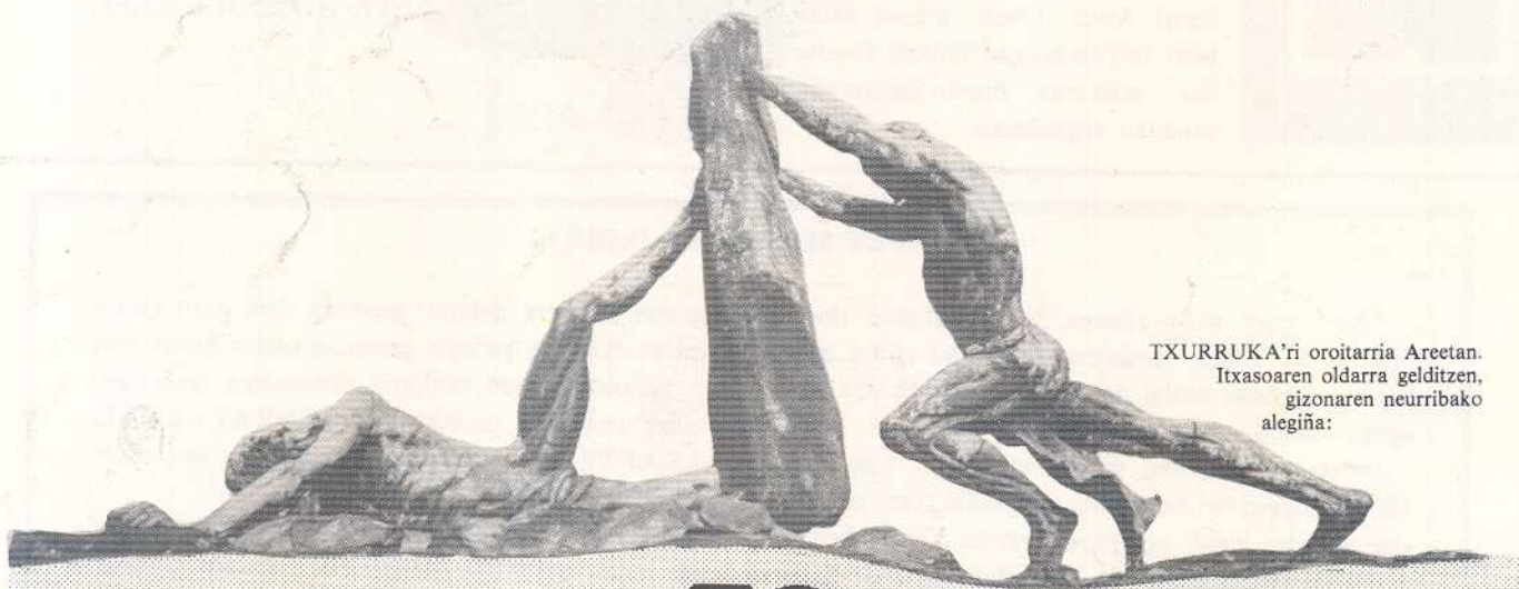
TXURRUKA'ri oroitarria Areetan. Itxasoaren oldarra gelditzen, gizonaren neurribako alegiña: