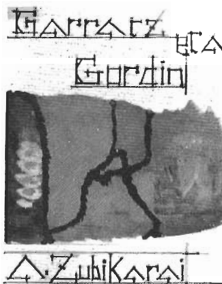
Garratz eta Gordin