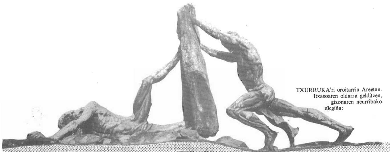
TXURRUKA'ri oroitarria Areetan. Itxasoaren oldarra gelditzen, gizonaren neurribako alegiña: