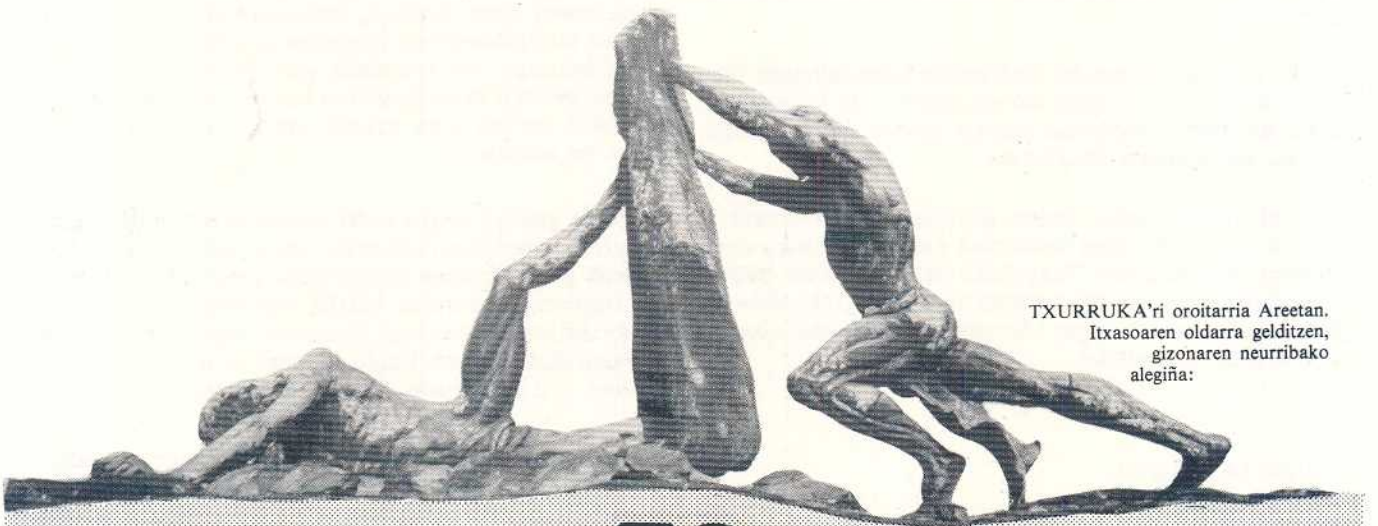
TXURRUKA'ri oroitarría Areetan. Itxasoaren oldarra gelditzen, gizonaren neurribako alegiña: