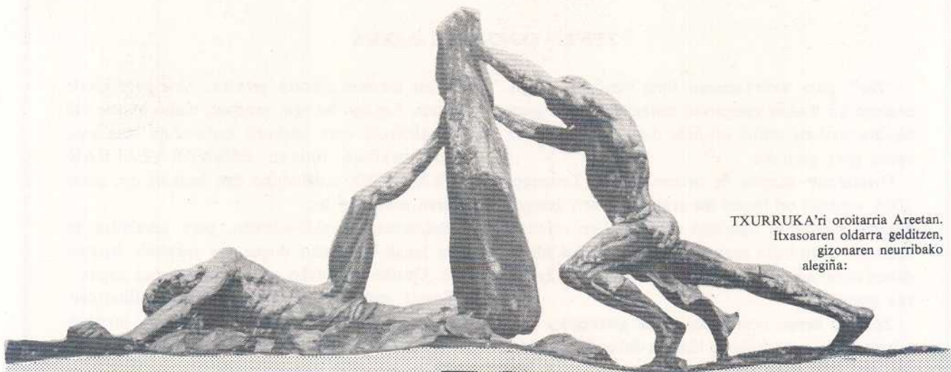
TXURRUKA'ri oroitarria Areetan. Itxasoaren oldarra gelditzen, gizonaren neurribako alegiña: