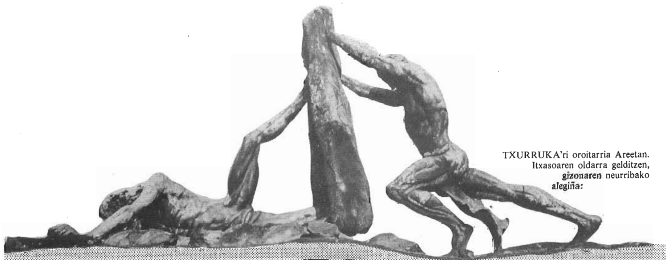
TXURRUKA'ri oroitarria Areetan. Itxasoaren oldarra gelditzen, gizonaren neurribako alegiña: