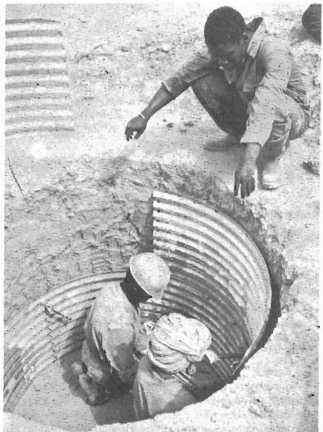
Afrikako lurralde legorretan uraren billa.