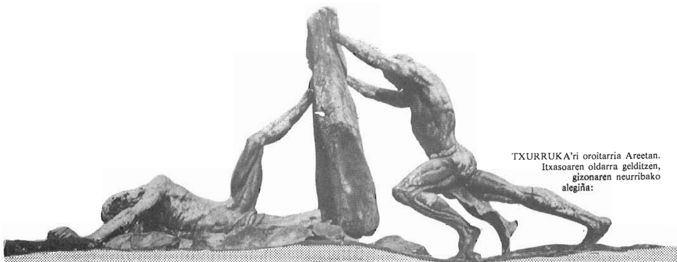
TXURRUKA'ri oroitarria Areetan. Itxasoaren oldarra gelditzen, gizonaren neurribako alegiña: