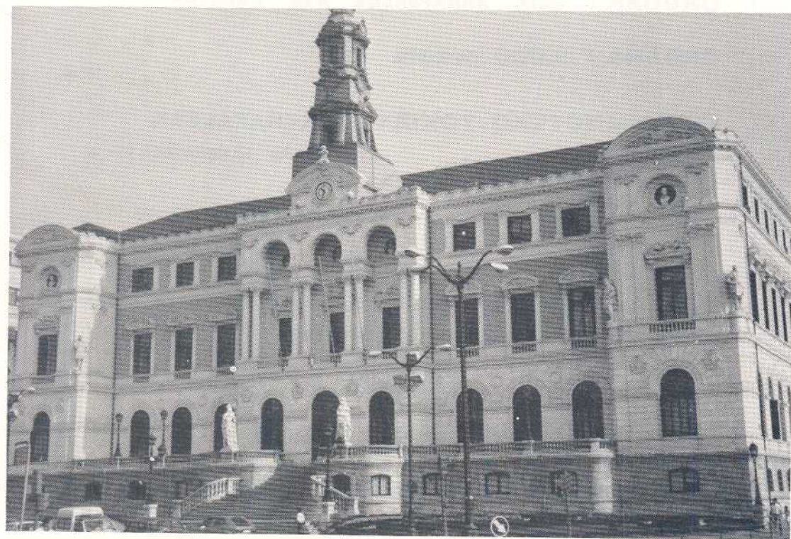
BILBO'KO UDALETXEA ARGI TA GARBI

BIZKAITARRAI BIZKAIERAZ 90n. ZENBAKIA URRILLA 1985