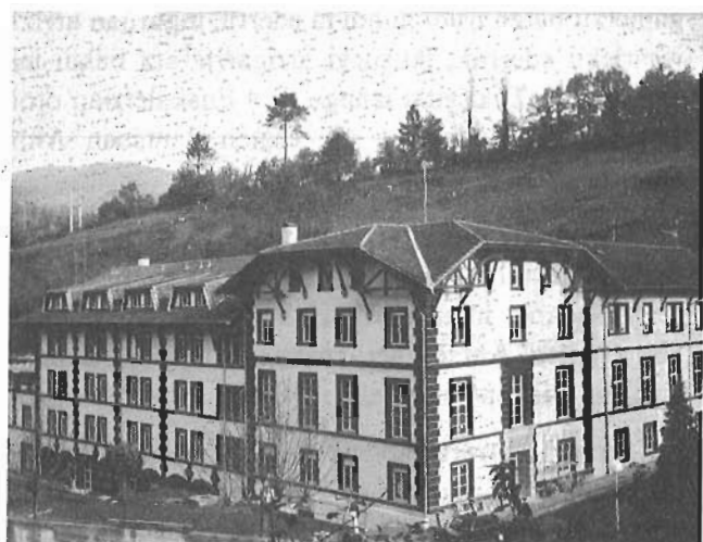
Karrantza'ko "El Molinar"en lekaide Paloti'tarrak egoitz eder bat dauke. Udaldirako toki egokia. Or egun batzuk igaroten dozuzan artean, Euskalerrriaren zatia dan Karrantza ezagutzeko erea izango dozu.