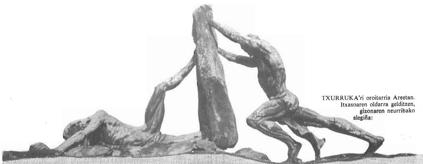
TXURRUKA'ri oroitarria Areetan. Itxasoaren oldarra gelditzen, gizonaren neurribako alegiña: