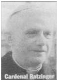
Vida Nueva, 4-II-1995