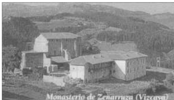
Vida Nueva, 4-11-1995