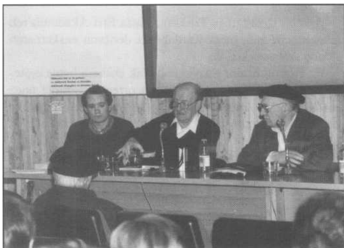
A rrjnda'tar Ant's'ek odoleko RH'ren arawo argitzeko adibideak erabilten dauz.