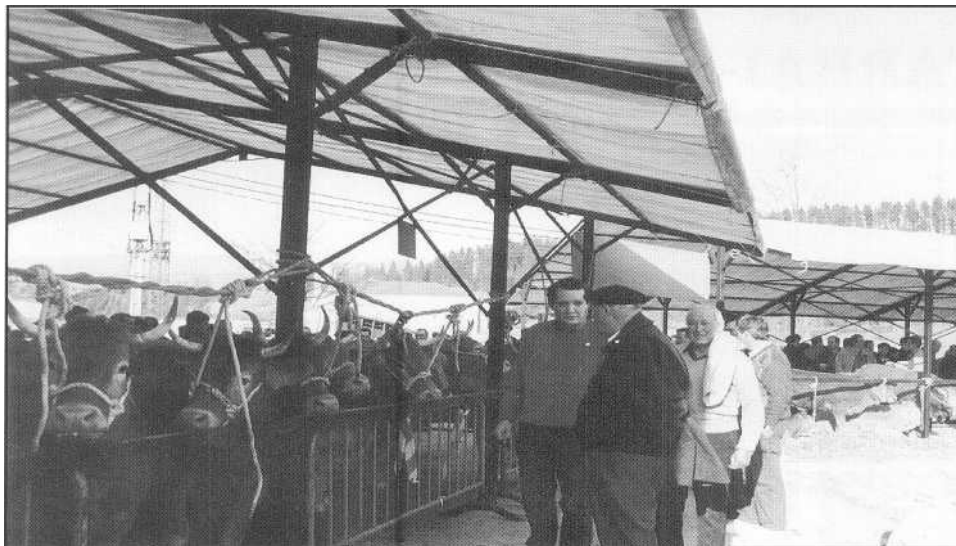
Abctd ñu 'n San Blasetan, A.~ er Buserriicn-ruku.: trutrfaun.

Abadiño'n San Blasetan Abadiño'n San Blasetan neskazarrak bentanetan neskazarrak bentanetan mutilzarrak engañetan mutilzarrak engañetan Abadiño'n San Blasetan.