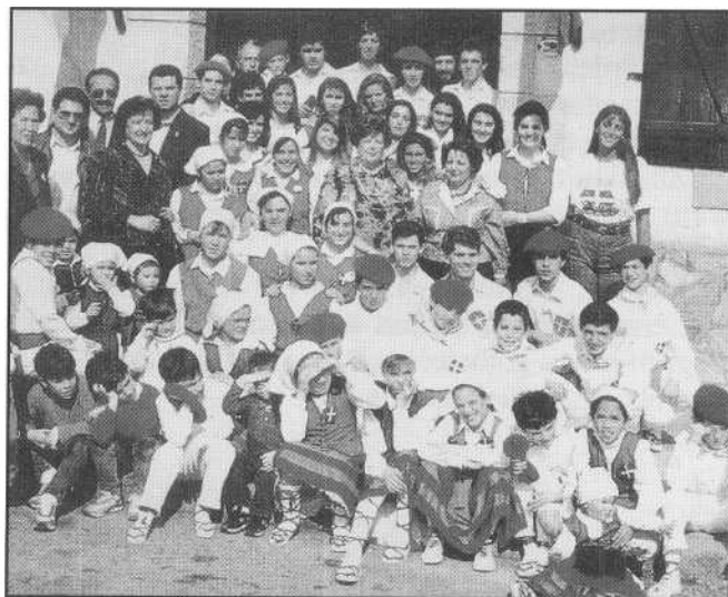
eban, Landeretxe umezurtztegia eta beste eginbear asko beteteko iraspenak sortuta.