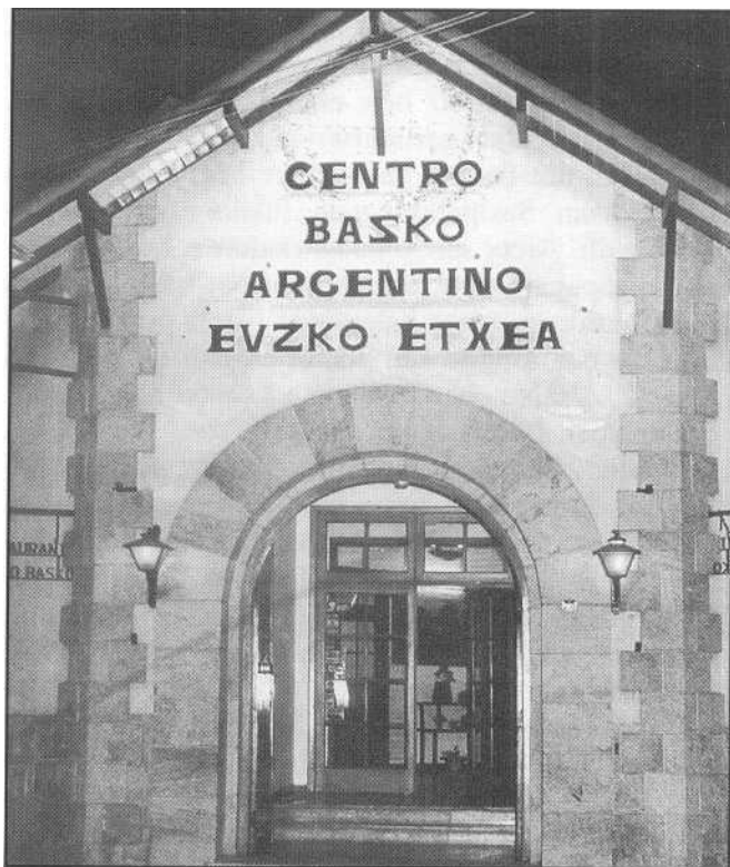
Ar/enriña'n euskul giroa sortt eban 'Zuuruk Bal'ek.

Batzokiak bere ondoren on eta aundia artu eban. Beronek, illero, arpidedunen diru-laguntzaz baliatuz, euskotar umezurtzen eta babes-bakoen ardurea artu