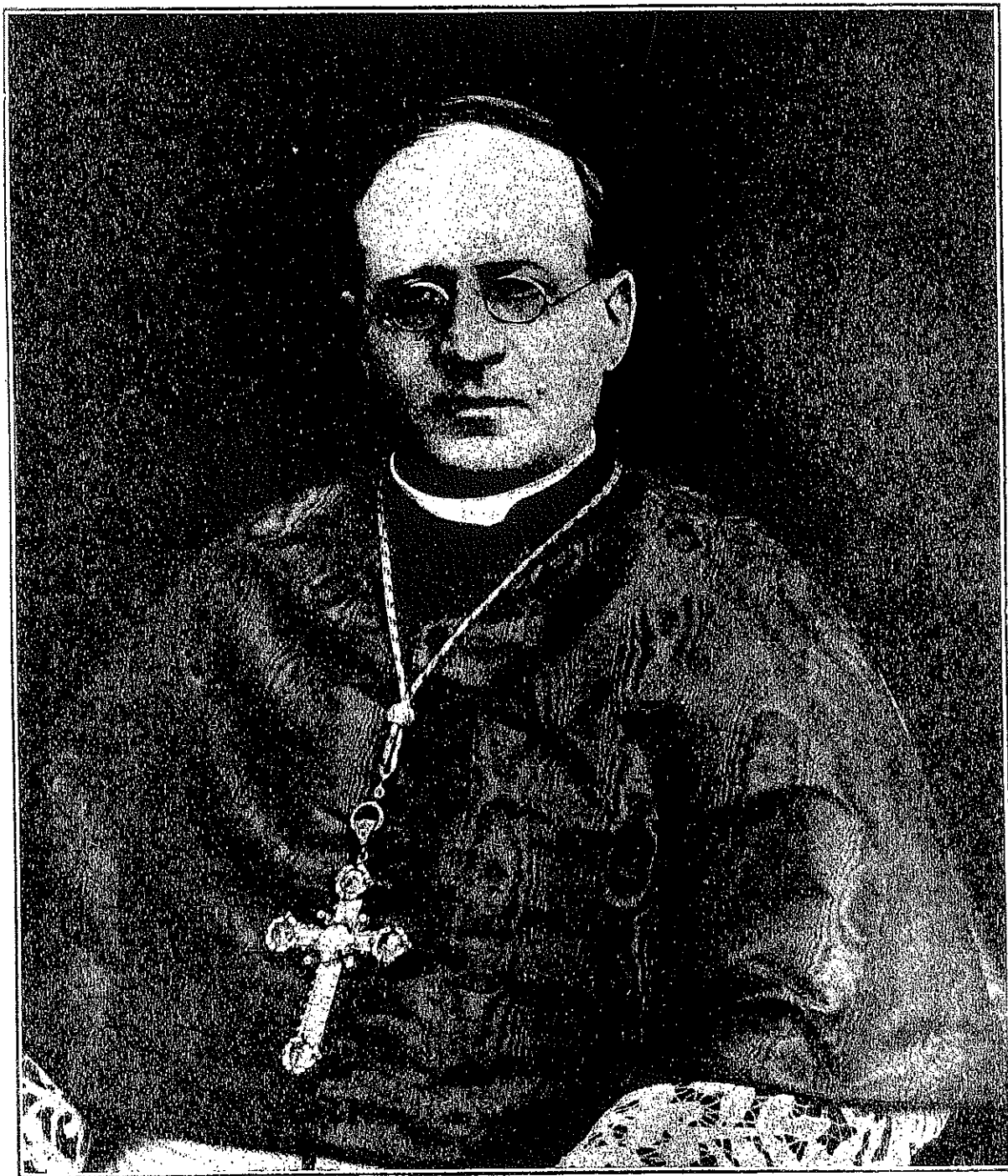
XI PIO, DOIPURUBA

Oraintxe esan dodanez Aita Santu ta Italiako Gobernuaren asañeak ofen luzaro irautearen efurik andiena masoyak izan eben; etzirean baña izan bakañik. Kätoli-